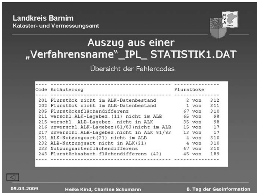
Abb. 1: Differenzen zwischen ALK und ALB

Der Vergleich der Flächenstatistik mit alternativen Ansätzen zur Flächennutzungsbilanzierung, wie dem IÖR-Monitor, unterliegt erheblichen methodischen Problemen. So ist die eigentliche Quelle der Flächenstatistik (das ALB) aus Datenschutzgründen nicht zugänglich, was einen lokalen Vergleich von Quell- und Ergebnisdaten ausschließt und das Aufspüren von Differenzen unmöglich macht. So muss auf die indirekte Quelle ALK zurückgegriffen werden. Diese enthält flächendeckend Geometriedaten der Flurstücke und deren Flächennutzung. Mit der Zusammenführung von ALB und ALK zu dem Amtlichen Liegenschaftskataster Informationssystem ALKIS im Zuge des AAA-Projekts (AdV 2008) wurden die erheblichen Differenzen zwischen den Nutzungseinträgen in ALB und ALK augenscheinlich. Wie groß diese teilweise sind, macht beispielhaft am Landkreis Barnim Abbildung 1 deutlich.